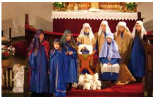
Julaften i Borgestad kirke. Jentekoret tok oss med til Jesu fødsel i Betlehem med sitt flotte julespill.