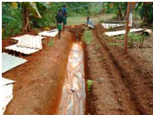
Enkelt biogassanlegg legges ned i bakken