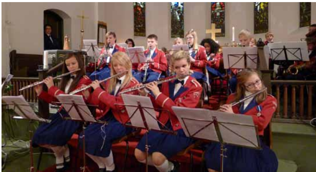
Menstad skolekorps gledet alle med sitt flotte spill på den tradisjonelle julekonserten i Borgestad kirke, 2. søndag i advent.