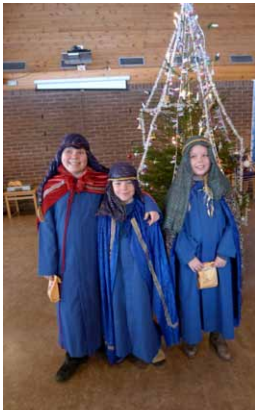
På juletreffesten etter gudstjenesten 8. januar kom "De tre vise menn" med gaver til barn og voksne.