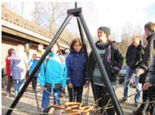
11-åringene som deltok på "Lys Våken" overnattet i kirken natt til 1. søndag i advent. Etter gudstjenesten på søndag smakte det godt med pølser på spidd.